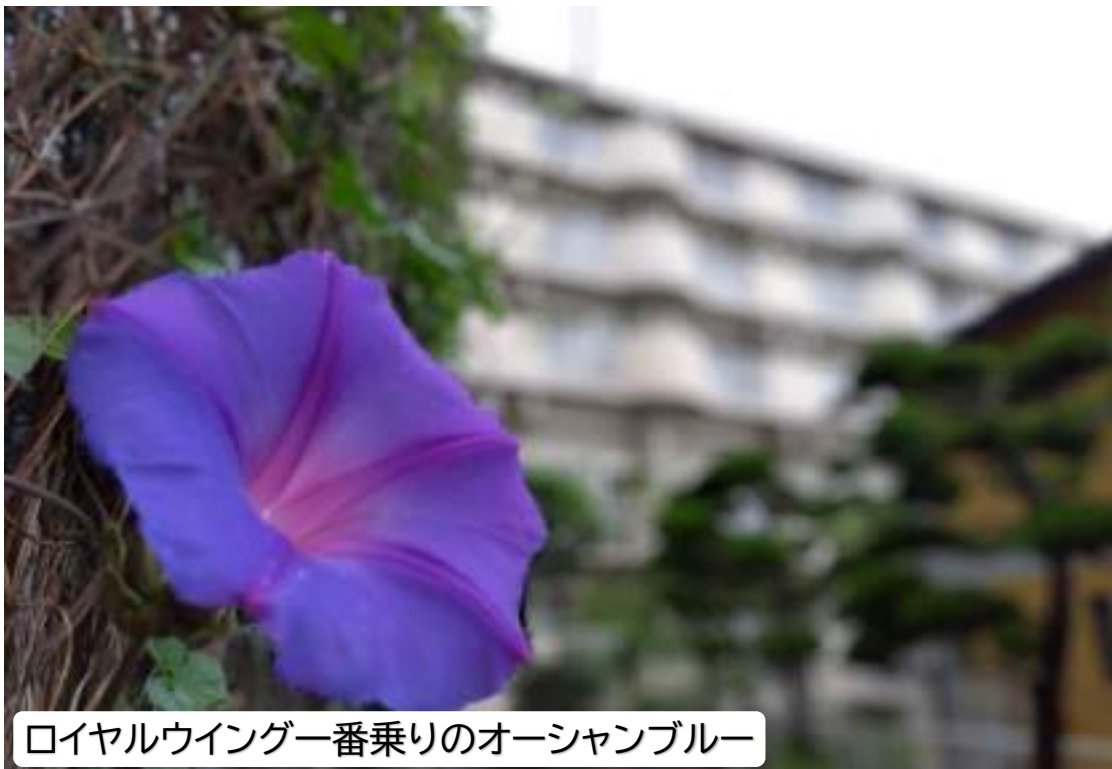
ロイヤルウイング一番乗りのオーシャンブルー

令和6年6月1日発行 社会福祉法人 王慈福社会 ケアハウス ロイヤルウイング 倉敷市児島下の町5-2-15 (086)-474-0001