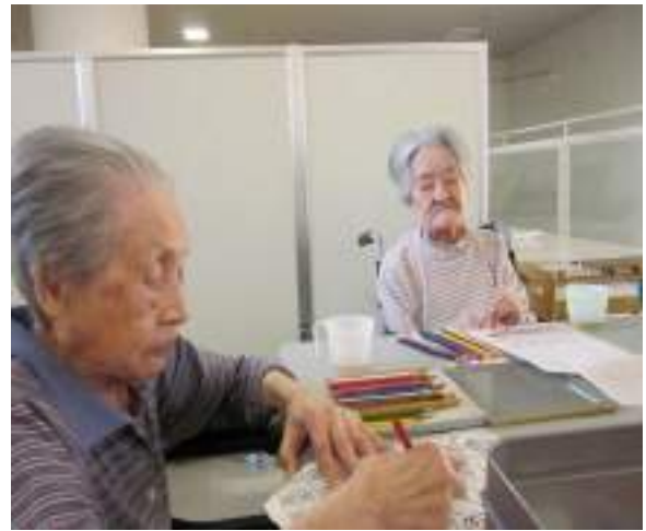
余暇時間にこんなことしています